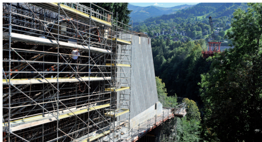
Essais de fluage sur bétons

L'incorporation de fibres métalliques optimise les caractéristiques des Defiperf hautes performances en matière de flexion, d'abrasion, de ductilité et de résilience.